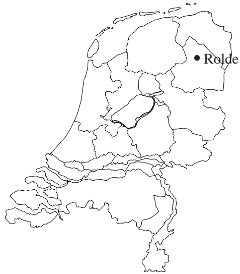
Afbeelding 1 De ligging van het onderzoeksgebied.