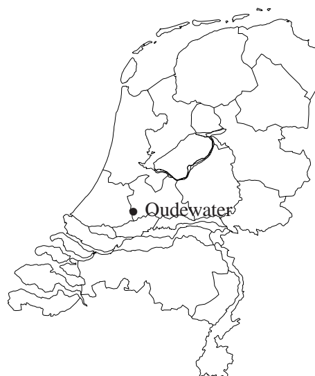
Afbeelding 1 De ligging van het onderzoeksgebied, aangegeven met een zwarte pijl.