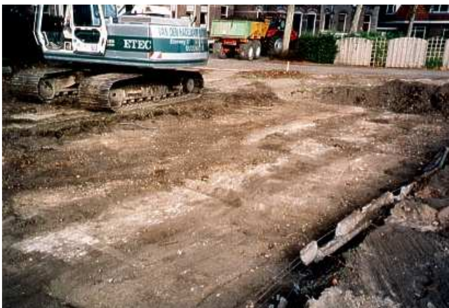
Afbeelding 2 Overzicht van het opgravingsterrein, met aan de rechterkant een recente puinbaan.