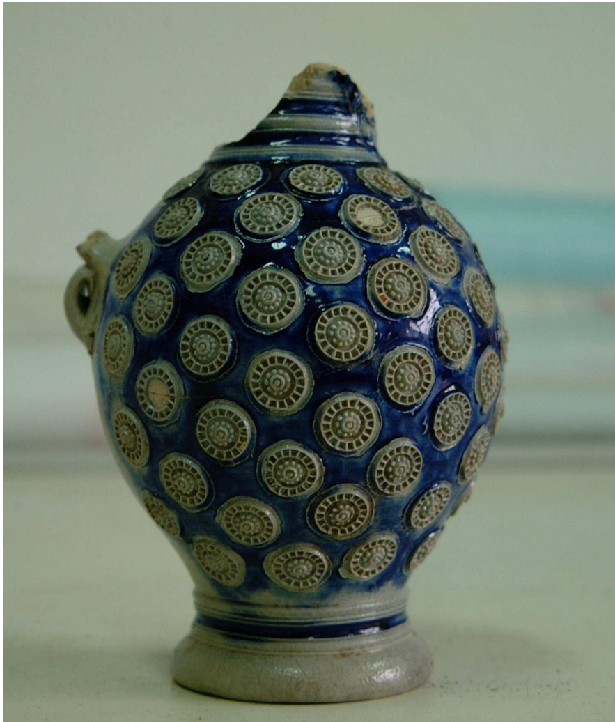
Afbeelding 5 Steengoed kruikje afkomstig uit Westerwald.