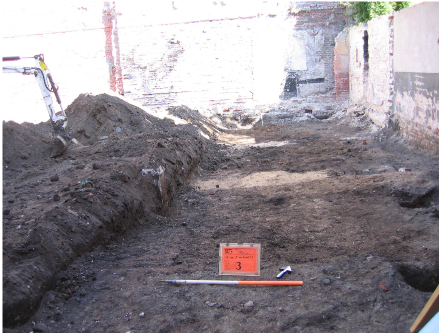
Afbeelding 4 Overzicht van vlak 2 in werkput 1.

gedraaid roodbakend aardewerk voorzien van loodglazuur, tinglazuuraardewerk (zowel majolica als faience), steengoed, pijp-aardewerk, witbakkend aardewerk en een enkel stuk porselein. Het meest complete voorwerp is een steengoed kruikje afkomstig uit Westerwald (afb. 5). Van dit kruikje, dat 17 cm hoog is, mist het grootste deel van de hals en het oor. De buik is voorzien van grijze gestempelde rozetten op een kobaltblauwe achtergrond en op de hals is nog net de baard van een kop zichtbaar. Dit stuk dateert uit de tweede helft van de 17e eeuw. Het kruikje werd geborgen tijdens de aanleg van vlak 2 in werkput 1.