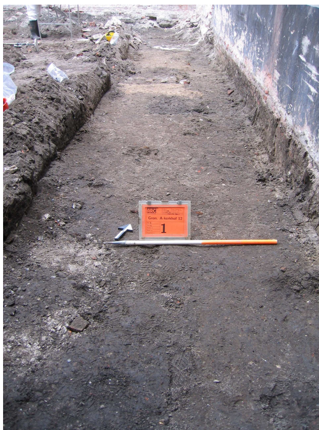
Afbeelding 3 Overzicht van vlak 1 in werkput 1.