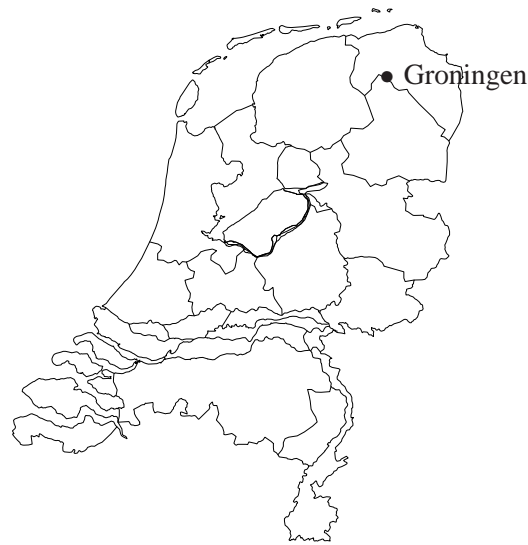
Afbeelding 1 De ligging van het onderzoeksgebied.