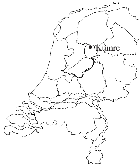
Afbeelding 1 De ligging van het onderzoeksgebied.