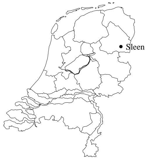
Afbeelding 1 De ligging van het onderzoeksgebied.