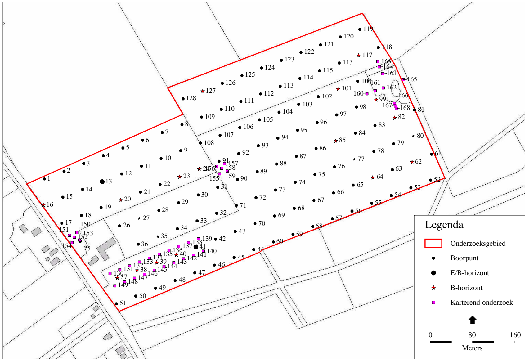
Afbeelding 4 Locatie van de boorpunten van het karterend onderzoek op de locatie bij Schoonoërstraat 63 te Grolloo. Kaart: B. Schomaker, ARC.