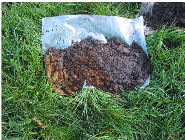
Afbeelding 6 De boorkern ( ca. 60 cm diep) van boring 148. Van rechts naar links: bouwvoor, E-horizont (lichtgrijs), B-horizont (donkerbruin), C-horizont (lichtgeelbruin)