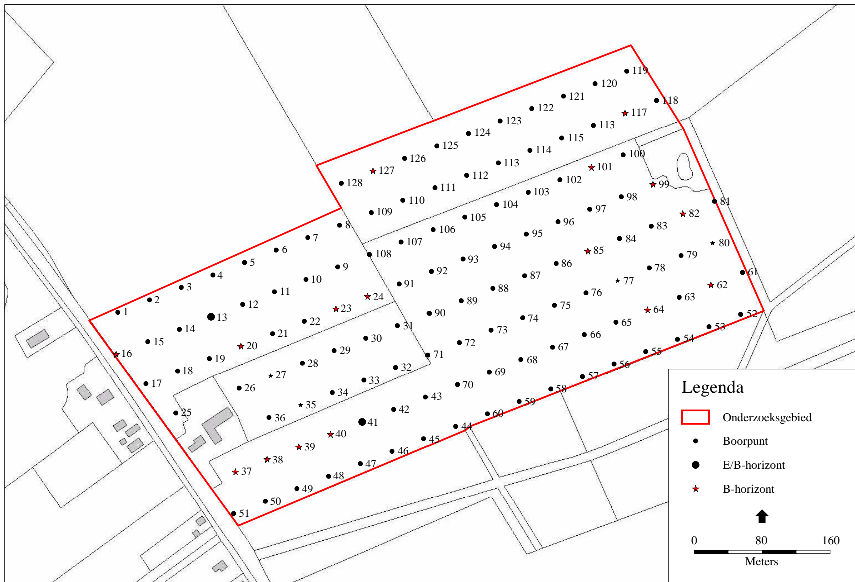
Afbeelding 2 Locatie van de boorpunten op de onderzoekslocatie bij Schoonloërstraat 63 te Grolloo. Kaart: B. Schomaker, ARC.