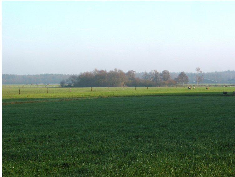
Afbeelding 7 Veengat of dobbe in de noordoosthoek van het onderzochte terrein

zeer waarschijnlijk dat de mogelijke vindplaats in de huidige bouwvoor is opgenomen. Daardoor wordt de kans op het terrein nog archeologische waarden in situ aan te treffen, gering geacht. Aanbevolen wordt dan ook het terrein vrij te geven voor de voorgenomen activiteiten. Omdat echter een vindplaats aanwezig kan zijn geweest, is het van belang, dat wanneer bij de uitvoering onverhoopt grondsporen en/of vondsten worden aangetroffen, hiervan direct melding wordt gemaakt bij de provinciaal archeoloog. 4