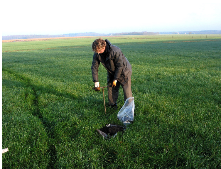
Afbeelding 5 Veldboring