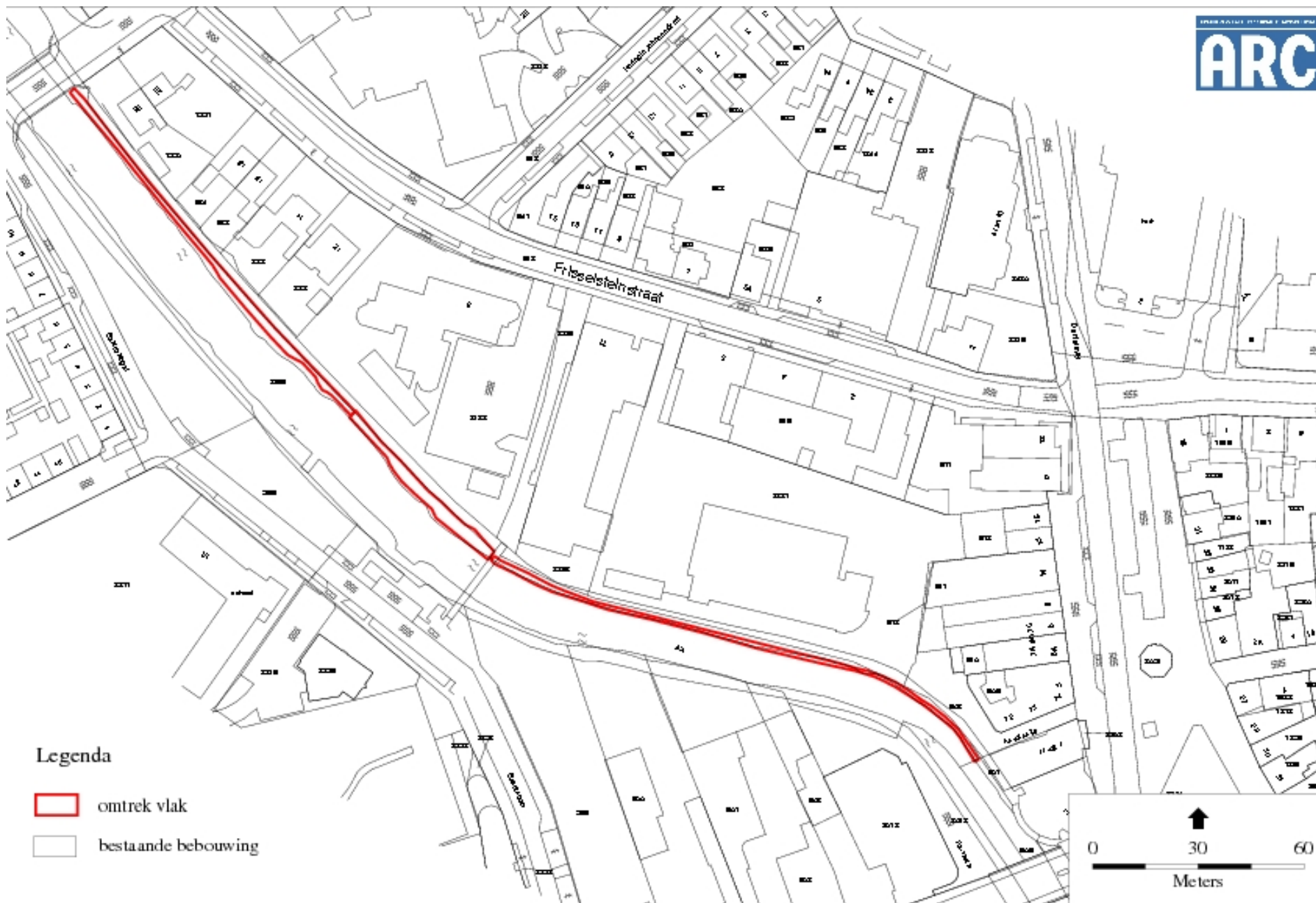
Afbeelding 2. De locatie van vindplaats B met de aangelegde werkputten. Kaart: M.C. Botermans.